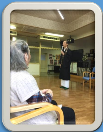
覚円寺ご住職によるお説法